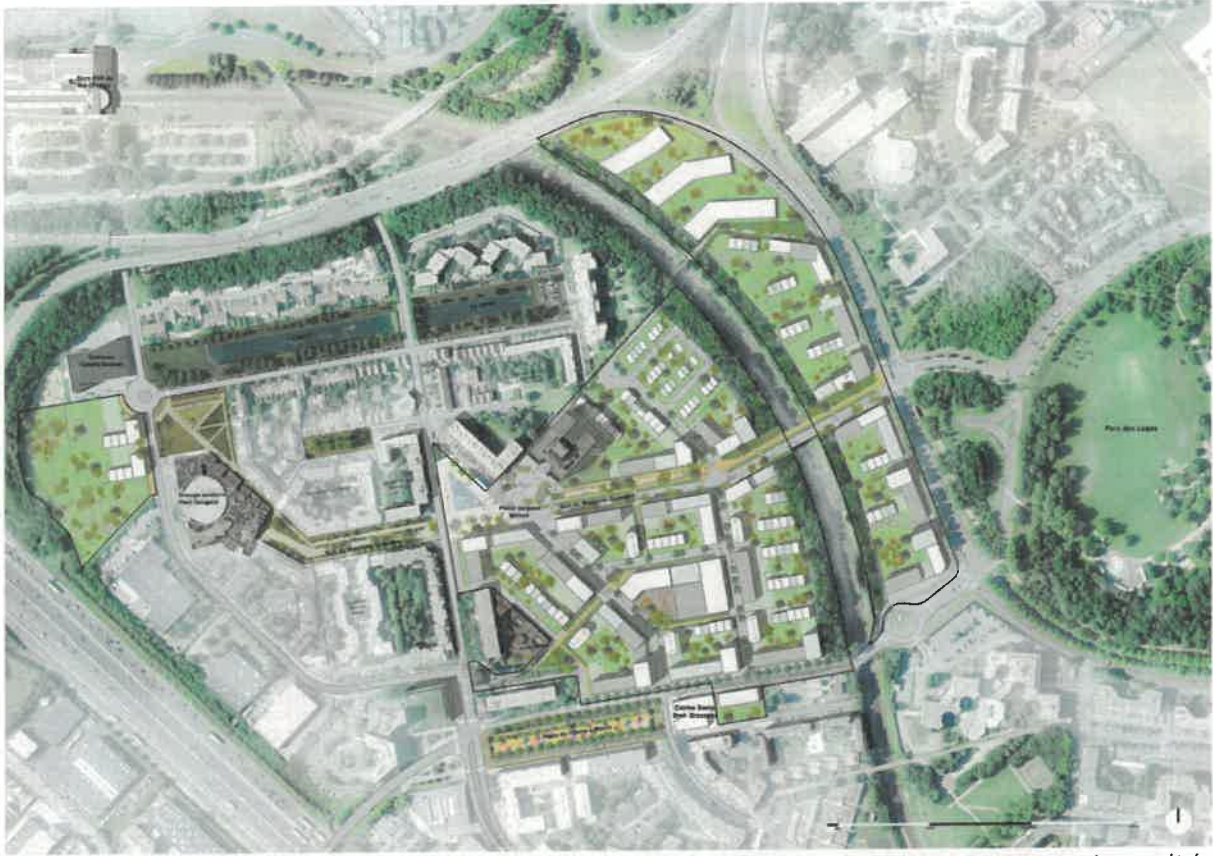
Plan guide de la ZAC des Horizons, 2019 – Ateliers 2/3/4

La programmation de la ZAC prévoit la réalisation d'un total de 140 000 m 2 de surface de plancher (sdp) :