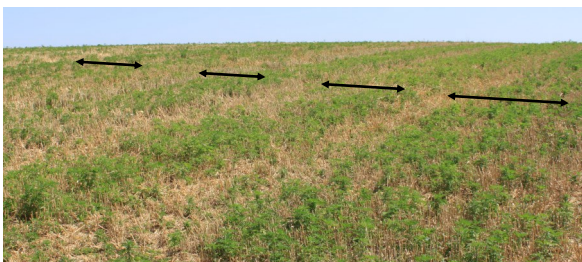
« Bandes d'ambroisies » laissées par la moissonneuse-batteuse